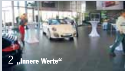
2 „Innere Werte“