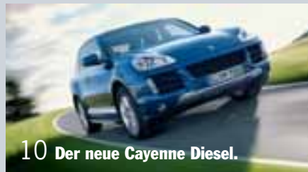
10 Der neue Cayenne Diesel.