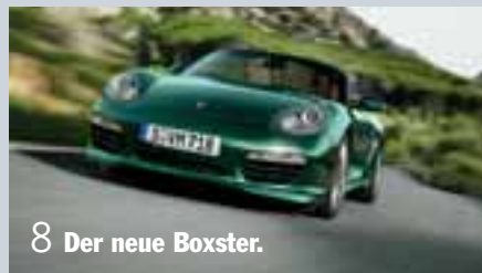
8 Der neue Boxster.