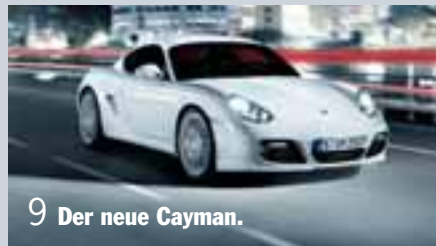
9 Der neue Cayman.