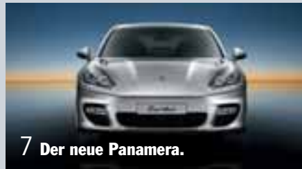
7 Der neue Panamera.