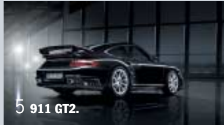
5 911 GT2.