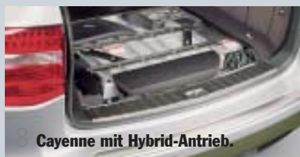
8 Cayenne mit Hybrid-Antrieb.