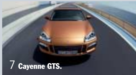
7 Cayenne GTS.