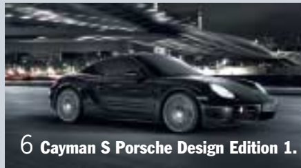
6 Cayman S Porsche Design Edition 1.